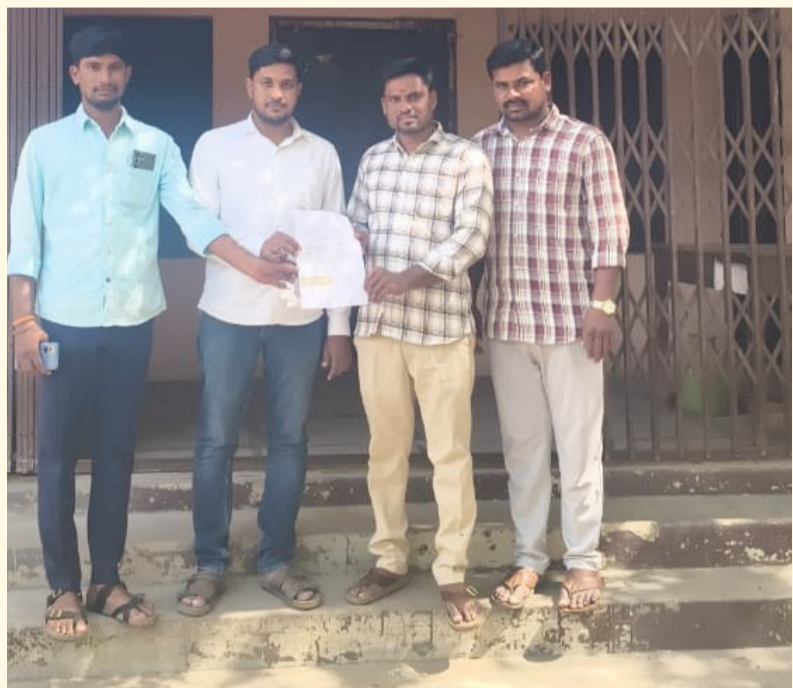
మక్తల్ 22 జూన్ (సామాజిక తెలంగాణ)

-ఆర్ టి ఐ దరఖాస్తు సమర్పణ కలాల్ రామన్ గౌడ్ ధ్వజం