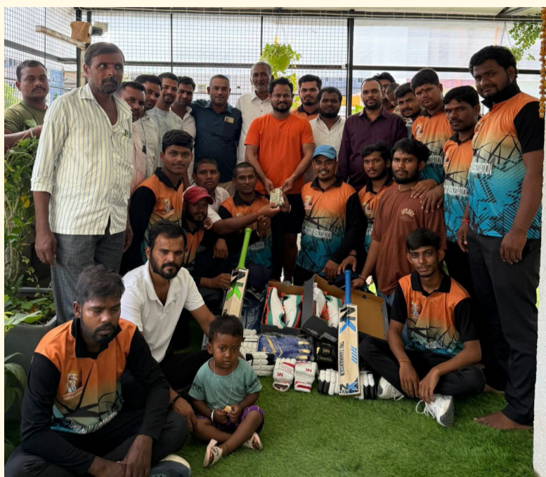
రంగారెడ్డి జిల్లా శంకర్పల్లి 22, జూన్ ( సామాజిక తెలంగాణ )

-మోకిలా తాండ యువతకు రూ.2.5 లక్షల విలువైన క్రికెట్ కిట్, జెర్సీల పంపిణీ చేసిన : వర్త బాబు నాయక్