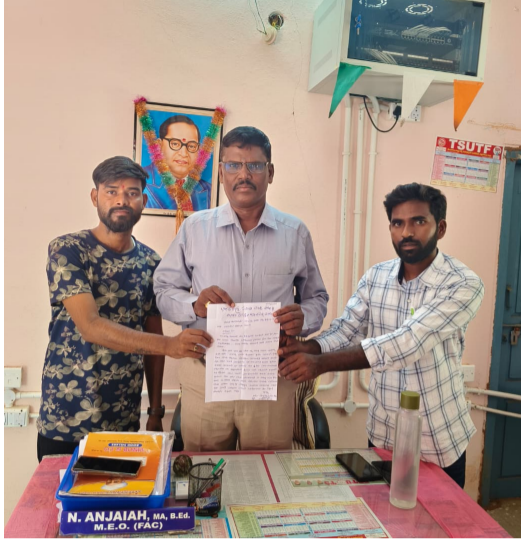
అధిక ధరలకు విక్రయిస్తూ తల్లిదండ్రులను ఆర్థికంగా దోపిడీ చేస్తున్నారని ఆరోపించారు. మొదటి తరగతి నుంచి పదో తరగతి వరకు చదివే విద్యార్థులకు అవసరానికి మించి పుస్తకాలు,