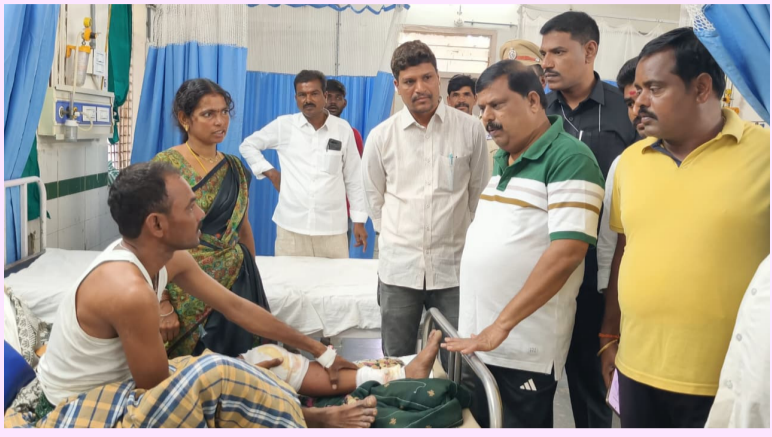
దేవరకొండ, జూన్ 17 సామాజిక తెలంగాణ

దేవరకొండ ప్రభుత్వ ఆసుపత్రిని దేవరకొండ ఎమ్మెల్యే నేనావత్ బాలు నాయక్ ఆకస్మికంగా తనిఖీ చేశారు. ఈ సందర్భంగా ఆసుపత్రిలో చికిత్స పొందుతున్న రోగులను స్వయంగా పరామర్శించి వారి ఆరోగ్య పరిస్థితులు, అందుతున్న వైద్య సేవల గురించి అడిగి తెలుసుకున్నారు. అనంతరం ఆసుపత్రిలో రోగులకు అందిస్తున్న భోజన వసతులను పరిశీలించి, భోజనం నాణ్యత ఎలా ఉందని రోగులను నేరుగా అడిగి తెలుసుకున్నారు. రోగులకు ఎటువంటి ఇబ్బందులు కలగకుండా మెరుగైన వైద్య సేవలు అందించాలని, అవసరమైన మందులు, సౌకర్యాలు అందుబాటులో ఉండేలా చర్యలు తీసుకోవాలని వైద్య సిబ్బందికి సూచించారు. ప్రభుత్వ ఆసుపత్రిలకు వచ్చే పేద మరియు మధ్యతరగతి ప్రజలకు నాణ్యమైన వైద్యం అందించడం ప్రభుత్వ ప్రధాన లక్ష్యమని ఎమ్మెల్యే పేర్కొన్నారు. రోగుల పట్ల వైద్యులు, సిబ్బంది మానవతా దృక్పథంతో వ్యవహరించాలని, ఆసుపత్రిలో పరిశుభ్రత, సేవల నాణ్యతను ఎప్పటికప్పుడు మెరుగు పరచాలని అధికారులను ఆదేశించారు. ఈ కార్యక్రమంలో ఆసుపత్రి వైద్యులు, సిబ్బంది, ప్రజాప్రతినిధులు మరియు కాంగ్రెస్ పార్టీ నాయకులు పాల్గొన్నారు.