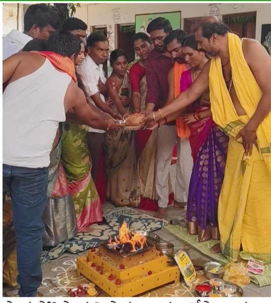
పాత్ర పోషిస్తున్న పాఠశాల ప్రధానోపాధ్యాయులు

అర్చూర్ పట్టణంలోని టీచర్స్ కాలనీలో గల శ్రీ సరస్వతీ విద్యా మందిర్ పాఠశాలలో బుధవారం గాయత్రీ యజ్ఞాన్ని అత్యంత భక్తిశ్రద్ధలతో ఘనంగా నిర్వహించారు. విద్యార్థుల సర్వతోముఖాభివృద్ధి, మంచి సంస్కారాలు, ఆధ్యాత్మిక చింతన పెంపొందించడం లక్ష్యంగా ఈ కార్యక్రమాన్ని ఏర్పాటు చేశారు. ఈ కార్యక్రమంలో వేద మంత్రోచ్ఛారణల మధ్య ప్రారంభమై, విద్యార్థులు, ఉపాధ్యాయులు, తల్లిదండ్రులు పెద్ద సంఖ్యలో పాల్గొని గాయత్రీ మంత్ర జపంతో యజ్ఞంలో పాల్గొన్నారు. యజ్ఞం ద్వారా మానసిక ప్రశాంతత, ఏకాగ్రత, సత్ప్రవర్తన అలవడతాయని, భారతీయ సంస్కృతి సంప్రదాయాలను భావితరాలకు చేరవేయడంలో ఇటువంటి కార్యక్రమాలు కీలక