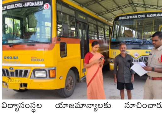
విద్యనంస్థల యాజమాన్యాలకు సూచించారు.