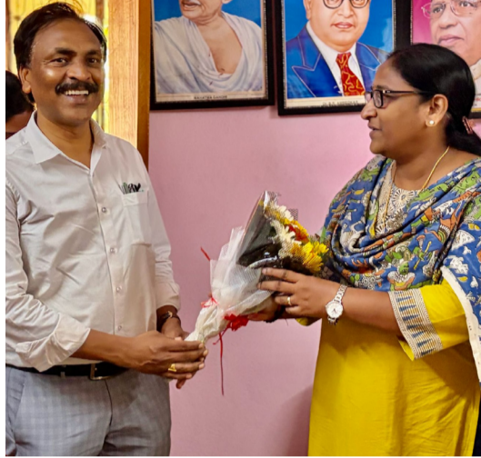
నారింజ బారేజ్ కు సంబంధించి పూర్తి వివరాలతో