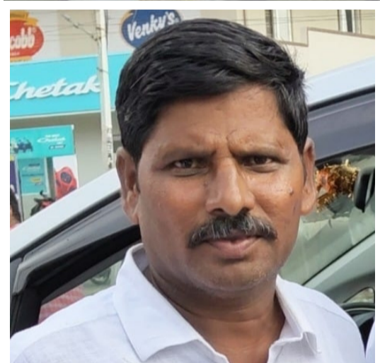
సకాలంలో విడుదల కాకపోవడం వలన 108