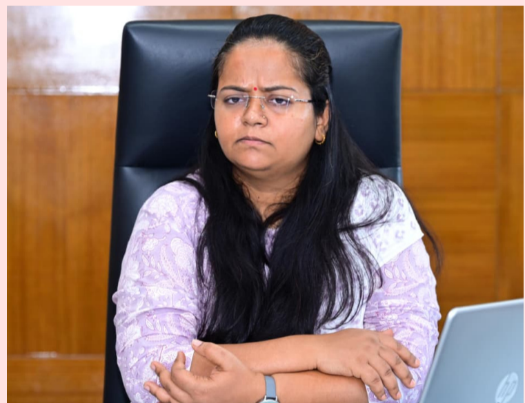
మెడక్, జూన్ 17 (సామాజిక తెలంగాణ):-

- జిల్లా రైతులకు 846.00 కోట్ల రూపాయలు చెల్లింపు - 507 ధాన్యం కొనుగోలు కేంద్రాలు కేంద్రాలలో కొనుగోలు పూర్తి - జిల్లా కలెక్టర్ ప్రతిమాసింగ్