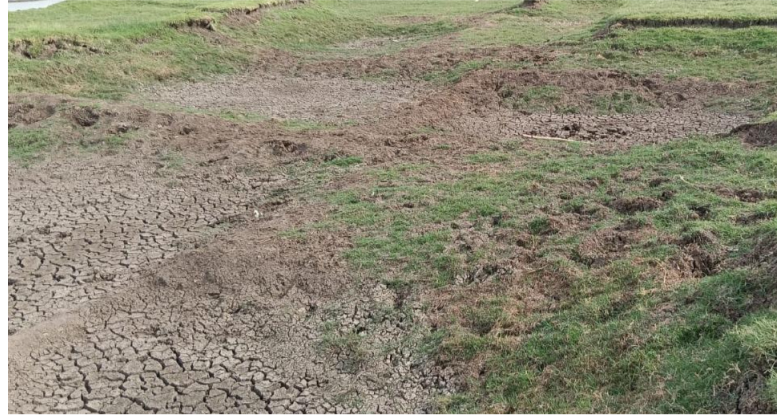
ఎలిగేడు, జూన్ 17 సామాజిక తెలంగాణ

ప్రస్తుత వాతావరణ పరిస్థితులను గమనిస్తుంటే కరువు ఛాయలు కమ్ముకొస్తున్నాయి. ఎల్ నిసో ప్రభావం తీవ్రంగా ఉండే అవకాశం ఉందని వాతావరణ శాఖ హెచ్చరించింది. పసిఫిక్ మహాసముద్రంలో పెరుగుతున్న ఉష్ణోగ్రతలు నైరుతి రుతుపవనాల గమనాన్ని మార్చేయడంతో వర్షపాతం తగ్గిపోతోంది. వరి, పప్పుధాన్యాలు, నూనెగింజలు వంటి వర్షాధార పంటలకు భారీ ముప్పు ఉందని నిపుణులు చెబుతున్నారు. రుతుపవనాలు బలహీనపడటంతో భూగర్భజలాలు అడుగుంటే రైతులకు తీరని నష్టం వాటిల్లుతుందని అధికారులు హెచ్చరిస్తున్నారు. ఎలిగేడు మండలంలో వర్షాధార సాగుపై ఆధారపడిన రైతులు ఆందోళనలో ఉన్నారు. పెట్టుబడులు పెట్టి పంట వేసిన తర్వాత వర్షాలు పడకపోతే ఆర్థిక నష్టాలు తప్పవని అన్నదాతలు ఆవేదన వ్యక్తం చేస్తున్నారు. వ్యవసాయ శాఖ అధికారులు ముందస్తు ప్రణాళికతో గ్రామసభలు నిర్వహించి రైతులకు అవగాహన కల్పించారు. నీటి లభ్యతను బట్టి పంటలు వేసుకోవాలని సూచించారు.