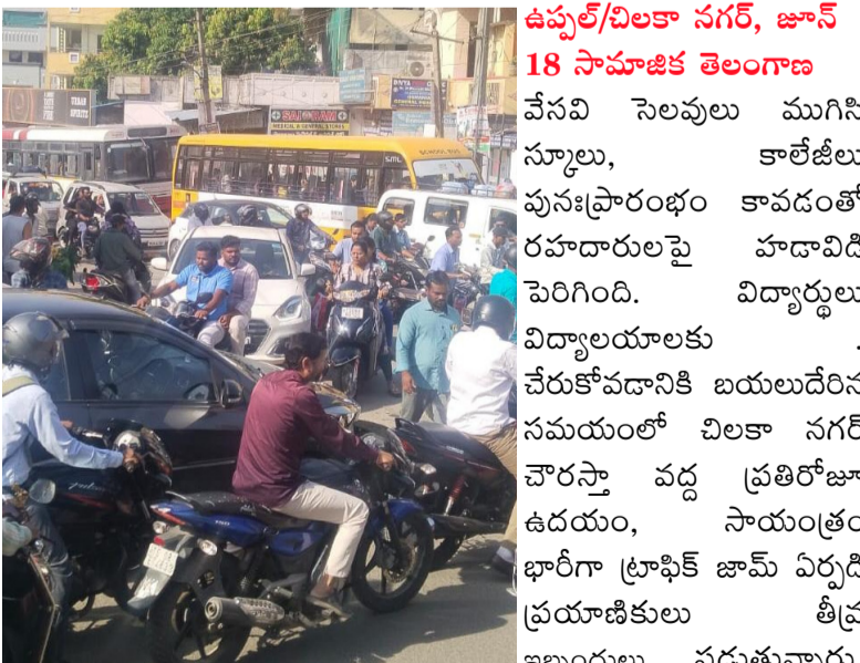
ఉప్పల్/చిలకా నగర్, జూన్ 18 సామాజిక తెలంగాణ

వేసవి సెలవులు ముగిసి స్కూలు, కాలేజీలు పునఃప్రారంభం కావడంతో రహదారులపై హడావిడి పెరిగింది. విద్యార్థులు విద్యాలయాలకు చేరుకోవడానికి బయలుదేరిన సమయంలో చిలకా నగర్ చౌరస్తా వద్ద ప్రతిరోజూ ఉదయం, సాయంత్రం భారీగా ట్రాఫిక్ జామ్ ఏర్పడి ప్రయాణికులు తీవ్ర ఇబ్బందులు పడుతున్నారు. భారీ వాహనాలు, ఆర్టీసీ బస్సులు, స్కూలు--కాలేజీ బస్సులు రద్దీని మరింత పెంచుతున్నాయి. అత్యవసర సేవల వాహనం 108 కూడా ట్రాఫిక్లో ఇరుక్కుపోయిన ఘటనలు చోటుచేసుకున్నాయి. ఉప్పల్ రింగ్ రోడ్డు మూసివేయడం, నో ఎంట్రి సమయంలో భారీ వాహనాలు ఈ రహదారులను ఎంచుకోవడం ప్రధాన కారణాలుగా స్థానికులు పేర్కొంటున్నారు. ప్రజలు ట్రాఫిక్ సమస్యను అధిగమించేందుకు ఒక ట్రాఫిక్ పోలీస్ అధికారిని నియమించాలని కోరుతున్నారు.