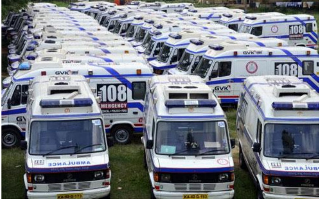
జోగులాంబ గద్దాల జిల్లా (సామాజిక తెలంగాణ దినపత్రిక) జూన్ 17 :