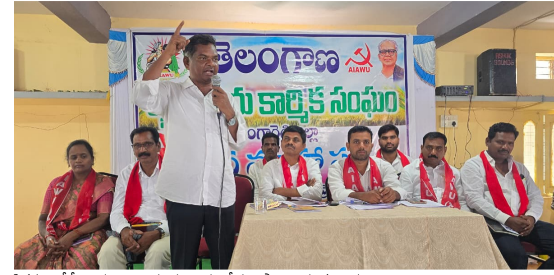
షాద్ నగర్ సామాజిక తెలంగాణ జూన్ 15: