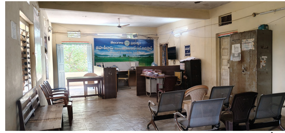
దౌల్తాబాద్ జూన్ 15(సామాజిక తెలంగాణ )

-పదకొండు దాటినా పత్తా లేని అధికారులు -ప్రజలకు నిరీక్షణ తప్పని పరిస్థితి