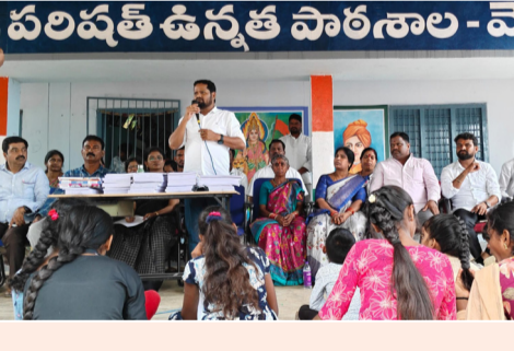
పరిషత్ ఉన్నత పాఠశాల - వెల్జాల్, జూన్ 15 సామాజిక తెలంగాణ