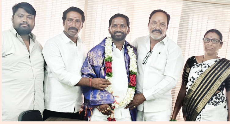
హైదరాబాద్, జూన్ 15 సామాజిక తెలంగాణ

-శుభాకాంక్షలు తెలిపిన బేడ బుడగ జంగం హక్కుల సాధన సమితి