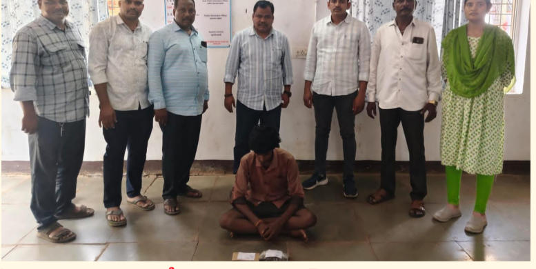
సామాజిక తెలంగాణ దోష మండలం జూన్ 12

-130 గ్రాముల ఎండు గంజాయి పట్టుకున్న ఎక్సైజ్ పోలీసులు