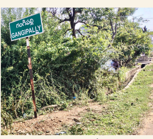
మంచిర్యాల జిల్లా ప్రతినధి, జూన్ 12, (సామాజిక తెలంగాణ):

మంచిర్యాల జిల్లా జైపూర్ మండలం గంగిపల్లి గ్రామ పంచాయతీలో డ్రైనేజీ వ్యవస్థ అస్తవ్యస్తంగా మారింది. ఇళ్ల మధ్య నుంచి వచ్చే మురికి నీరు ఎక్కడికీ పారక నిలిచి పోయింది. కొత్త