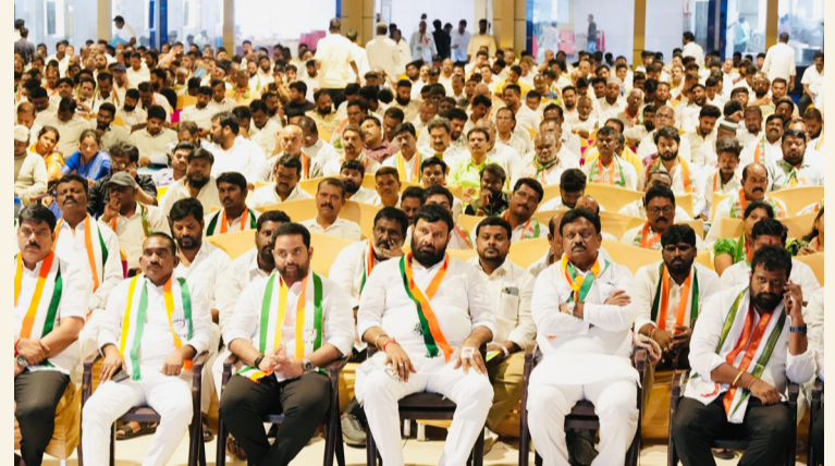
కుత్బుల్లాపూర్ సామాజిక తెలంగాణ.