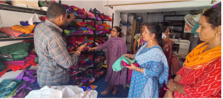
(కరీంనగర్ జిల్లా బ్యూరో/సామాజిక తెలంగాణ ప్రతిక ప్రతినిధి)జూన్-11 కరీంనగర్ నగరపాలక సంస్థ పరిధిలోని 17వ మరియు 18వ