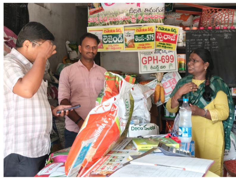
- రైతులకు నాణ్యమైన విత్తనాలు, ఎరువులు అందేలా చర్యలు తీసుకోవాలి.