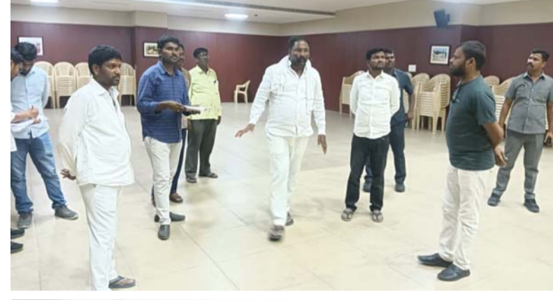
మక్తల్ మే 22 (సామాజిక తెలంగాణ)