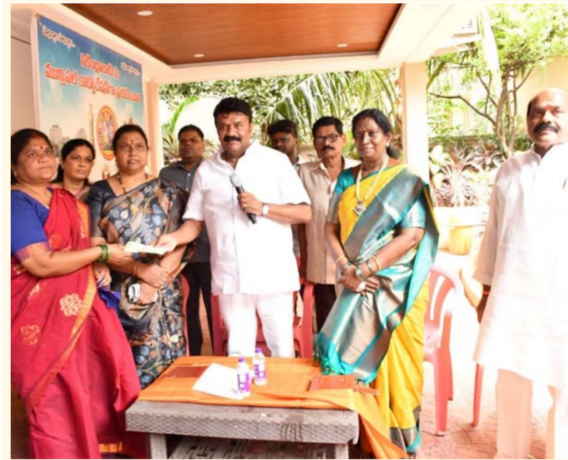
మే 22 వెస్ట్ మారేడ్ల (సామాజిక తెలంగాణ)

పేదంటి ఆడబిడ్డ పెండ్లికి ఆర్థికంగా చేయూత అందించే లక్ష్యంతో కళ్యాణ లక్ష్మి, షాదీముబారక్ కార్యక్రమాన్ని తెలంగాణ తొలి ముఖ్యమంత్రి కేసీఆర్ ప్రారంభించారని మాజీమంత్రి, ససత్ నగర్ ఎమ్మెల్యే తలసాని శ్రీనివాస్ యాదవ్ అన్నారు.