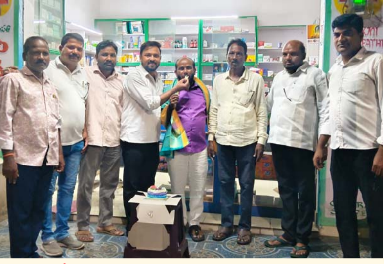
మంచురాల మే 22, (సామాజిక తెలంగాణ):

దళిత ప్రజల అభివృద్ధికి ఉత్తమ సామాజిక సేవలు అందించినందుకు గాను మంచురాల మే 22, (సామాజిక తెలంగాణ):