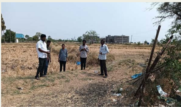
మక్తల్ మే 22 (సామాజిక తెలంగాణ)

-మంత్రి వాకిటి శ్రీహరి గారి ఆదేశాల మేరకు చర్యలు