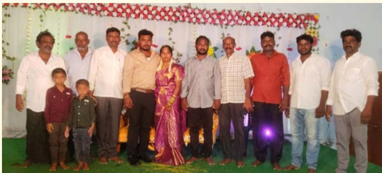
తల్లాడ మే 21, సామాజిక తెలంగాణ స్యూస్...

-కార్యక్రమంలో పాల్గొన్న పలువురు స్థానిక నాయకులు