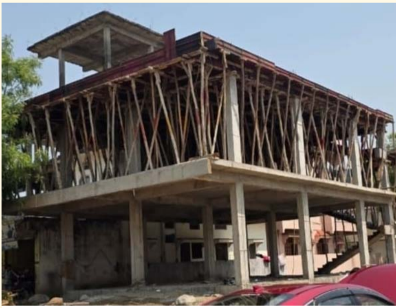
ఆర్కూర్,మే 22 (సామాజిక తెలంగాణ):

ఆర్కూర్ మున్సిపల్ పరిధిలోని పెరిట్ లోని 23వ వార్డులో నిజాంసాగర్ సబ్ కెనాల్ పై నిర్మించిన అక్రమ భవనాన్ని చర్యల నిమిత్తం ఎన్ ఫోర్స్ మెంట్ కు అప్పగిస్తామని శుక్రవారం నీటిపారుదల శాఖ అధికారులు తెలిపారు.