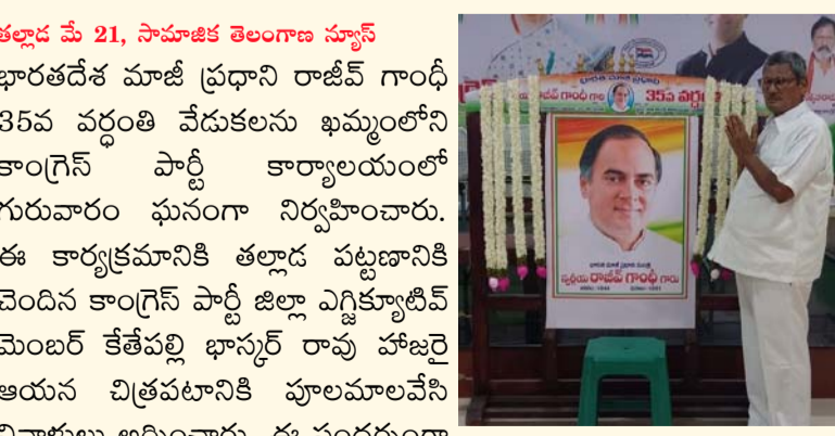
తల్లాడ మే 21, సామాజిక తెలంగాణ స్టూన్

- నివాళులర్పించిన కారెస్పాన్ డాక్టర్ ఈసీ మెంబర్ కేశవబ్లి