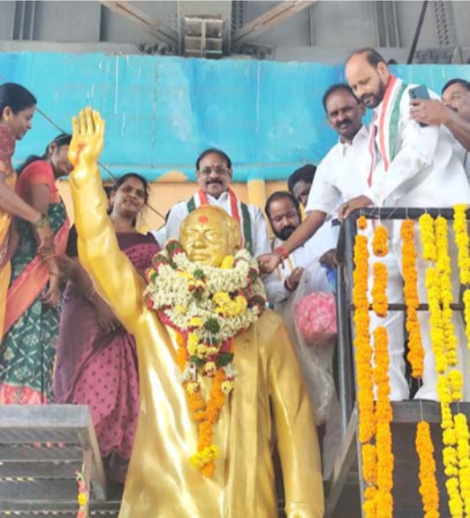
అభివృద్ధి పథంలో దూసుకుపోయింది అన్నారు. పేద ప్రజల అభివృద్ధి లక్ష్యంగానే కాంగ్రెస్ పాలన