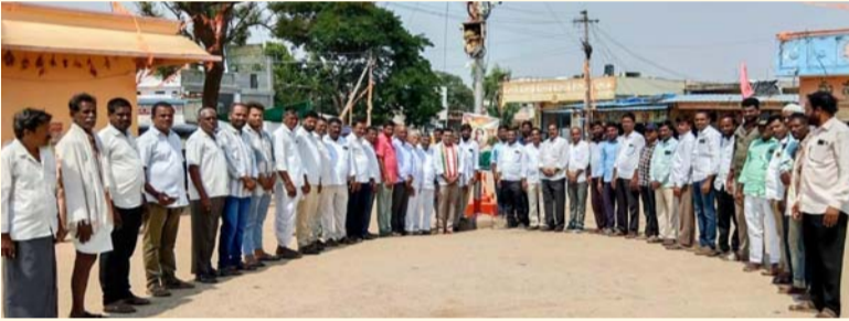
సామాజిక తెలంగాణ దోమ మండలం మే 21