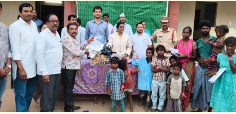
(సామాజిక తెలంగాణ ఆర్మూర్ ప్రతినధి మే 21)