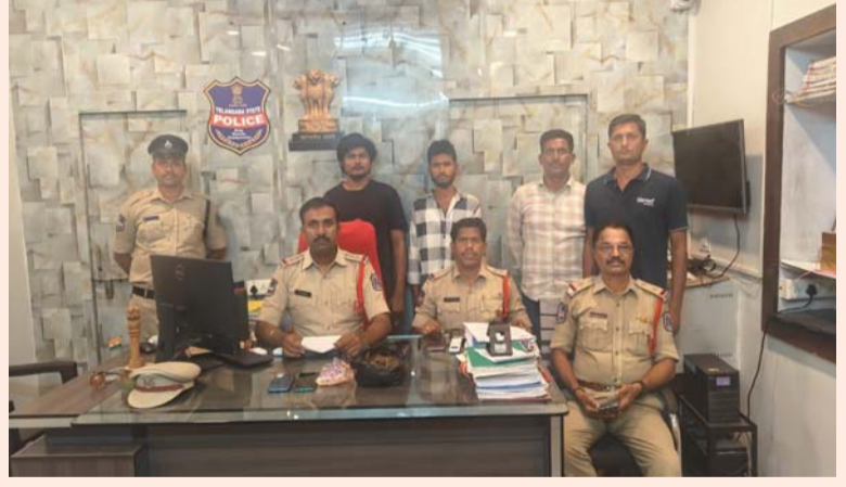
భువనగిరి, మే 20 సామాజిక తెలంగాణ