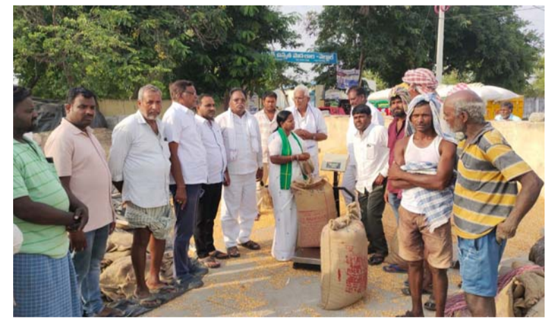
అమనగల్లు, మే 20 సామాజిక తెలంగాణ

- మార్కెట్ కమిటీ చైర్ పర్సన్ యాట గీత నర్సింహ