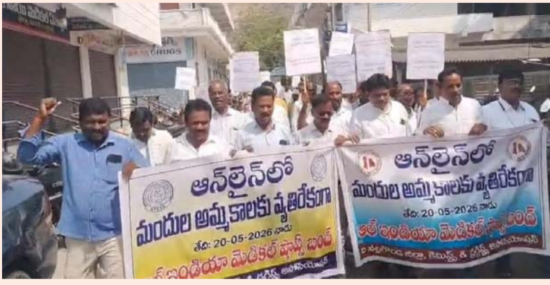
నల్లగొండ, మే 20 సామాజిక తెలంగాణ

ఆన్లైన్ ఫార్మసీల వల్ల నకిలీ ట్రిప్లిప్లతో మందుల పంపిణీ జరుగుతోందని, భారీ డిస్కాంట్లతో స్థానిక వ్యాపారులు నష్టపోతున్నారని కెమిస్టులు ఆందోళన వ్యక్తం చేశారు. వీటికి వ్యతిరేకంగా బుధవారం నల్లగొండలో మెడికల్ బండ్ పాటించి, భారీ నిరసన ర్యాలీ నిర్వహించారు. నిరసన నేపథ్యంలో పట్టణంలో మెడికల్ షాపులన్నీ పూర్తిగా మూతపడ్డాయి. నిబంధనల ఉల్లంఘనలను అరికట్టాలని, స్థానిక వ్యాపారులను ఆదుకోవాలని వారు డిమాండ్ చేశారు