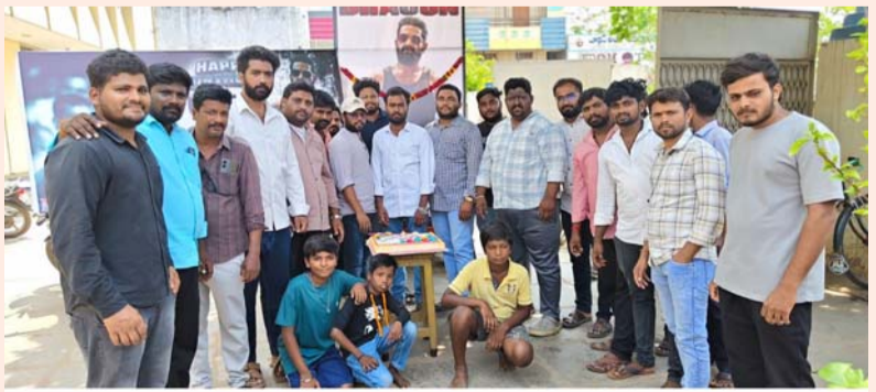
నందికొట్కూరు, మే 2 సామాజిక తెలంగాణ