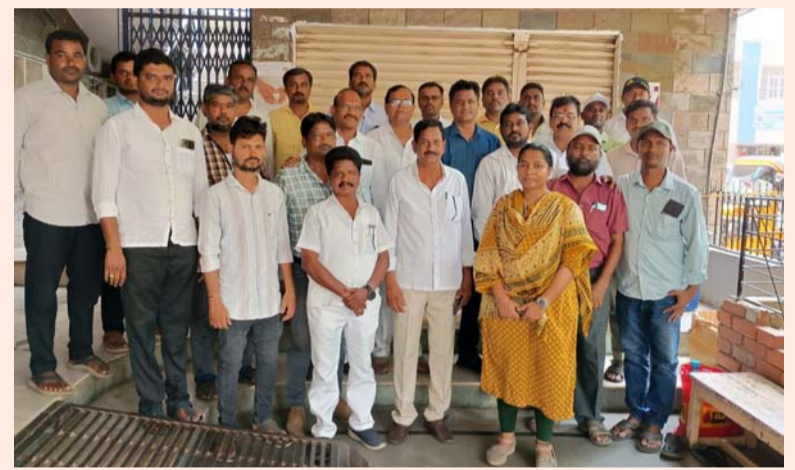
మహబూబాబాద్, మే 20 సామాజిక తెలంగాణ