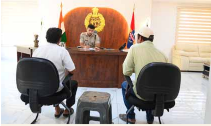
సత్కారం జిల్లా పోలీస్ కార్యాలయంలో పోలీస్ గ్రీవెన్స్ డే

-పిర్యాదుదారుల సమస్యలకు తక్షణ పరిష్కారం అందించేందుకు చర్యలు - జిల్లా ఎస్పీ శరత్ చంద్ర పవార్ ఐపీఎస్