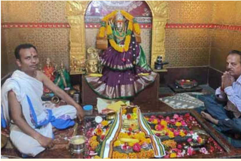
జహీరాబాద్, సామాజిక తెలంగాణ ప్రతినిధి,మే 18: