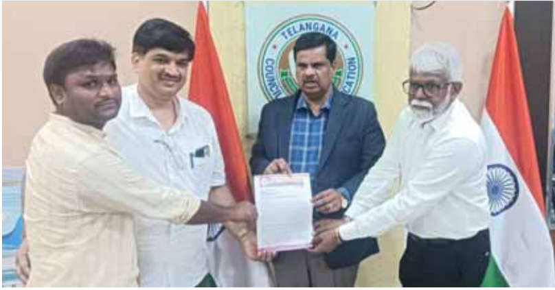
బషీర్ బాగ్, మే 18 (సామాజిక తెలంగాణ) :