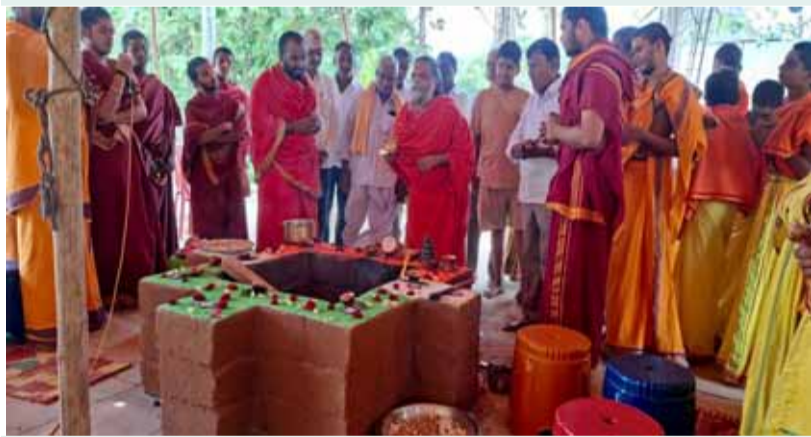
జహీరాబాద్: సామాజిక తెలంగాణ ప్రతినిధి మే 15.

- సర్కాంగ సుందరంగా దత్తక్షేత్రం - వేసవి దృ టీసీవ్ట్రా అన్ని ఏర్పాట్లు పూర్తి