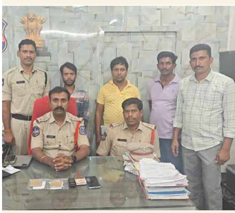
భువనగిరి, మే 15 సామాజిక తెలంగాణ

-ట్రాన్ షుగర్ అమ్ముతున్న నేరస్తులను పట్టుకున్న పోలీసులు -5లక్షలు విలువ గల డ్రగ్స్ స్వాధీనం -కేసు నమోదు చేసి రిమాండ్ కి తరలింపు