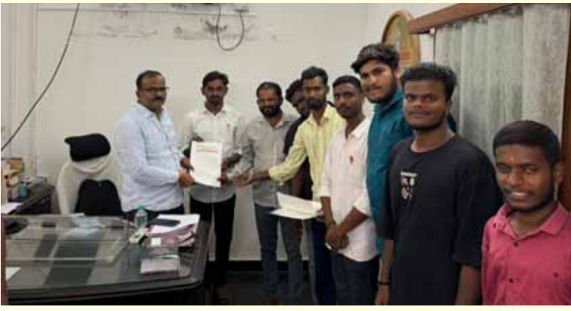
సామాజిక తెలంగాణ, యాదాద్రి భువనగిరి జిల్లా, చౌటుప్పల్ మున్సిపాలిటీ స్టూన్, మే 15

-డి.ఎన్.పి, సీఐ, ఎమ్మార్వోలకు విశ్వ హిందూం పరిషత్ బజరంగ్ కే వినతి