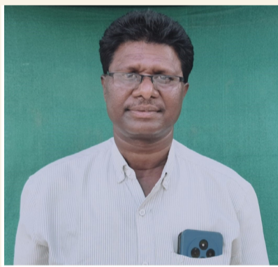
తల్లాడ ఏప్రిల్ 17, సామాజిక తెలంగాణ న్యూస్...

-మాడు దశాబ్దాలుగా వివిధ రంగాల్లో అంచలంచెలుగా ఎదిగిన తిమోతి..