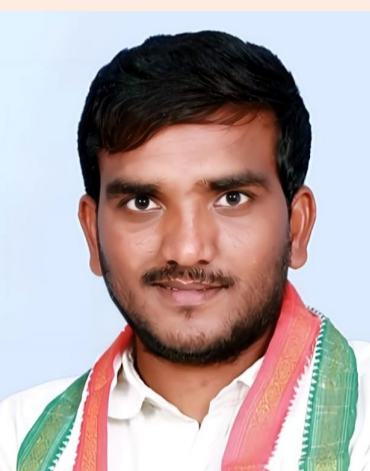
శాలిగౌరం, ఏప్రిల్ 17, (సామాజిక తెలంగాణ)