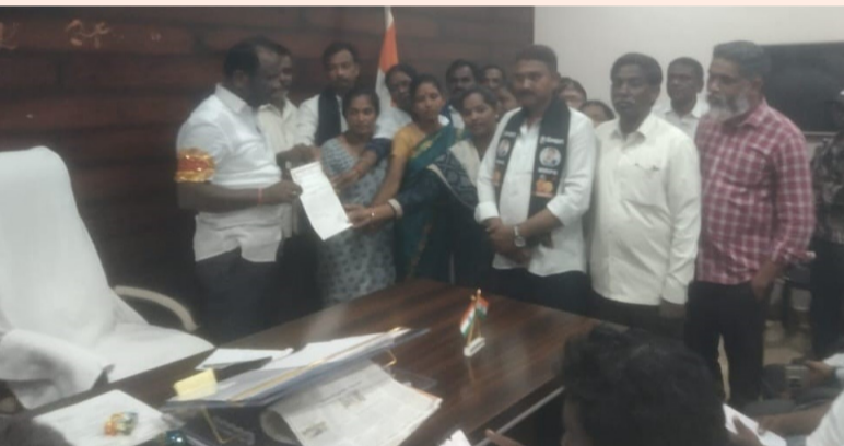
ఏప్రిల్ సామాజిక తెలంగాణ గోదావరిఖని స్వామి

- మహంకాళి స్వామి మేయర్ కి మంద కొమురమ్మ కాలనీవాసుల విజ్ఞప్తి