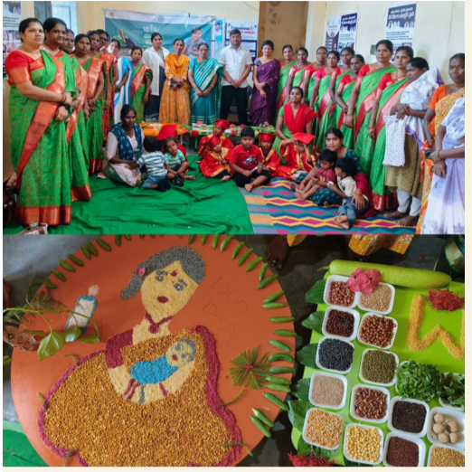
సామాజిక తెలంగాణ పీఏ పల్లి మండల ప్రతినిధి ఏప్రిల్ 15

పోషణ పక్వాడ కార్యక్రమం ఏప్రిల్ 9 ఏప్రిల్ 23 పీఏ పల్లి మండలం పరిధిలోని అంగడిపేట ఎక్స్ రోడ్ నందు పోషక పక్వాడ కార్యక్రమం నిర్వహించడం జరిగింది ఈ సంవత్సరం ప్రధాన ఉద్దేశం శిశువుల తాలి