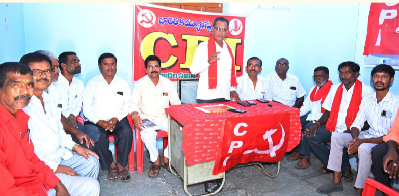
సామాజిక తెలంగాణ, యాదాద్రి భువనగిరి జిల్లా, చౌటుప్పల్ మున్సిపాలిటీ న్యూస్, ఏప్రిల్ 15