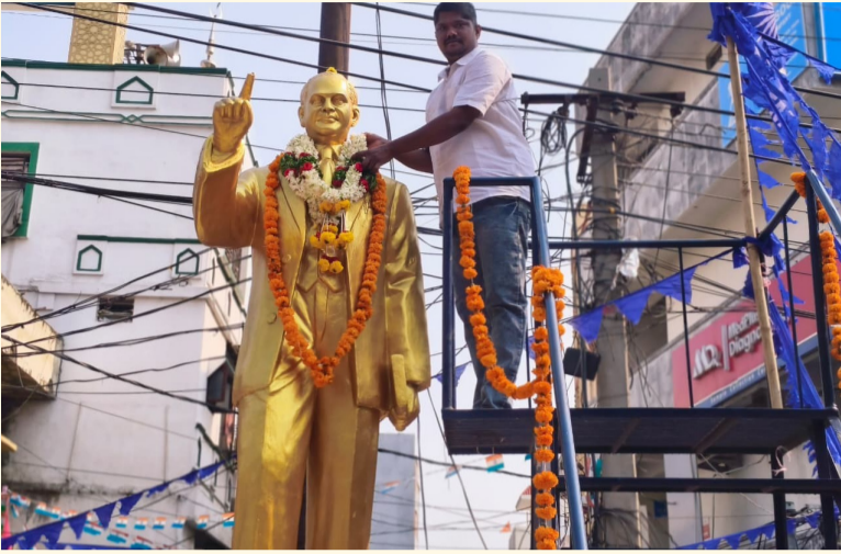
భువనగిరి, రూరల్ ఏప్రిల్ 15, సామాజిక తెలంగాణ

-నివాకులు అర్పించిన యువ నాయకులు సేవర్తి మధు