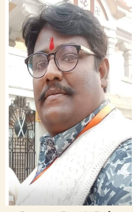
కూకట్లపల్లి సామాజిక తెలంగాణ.