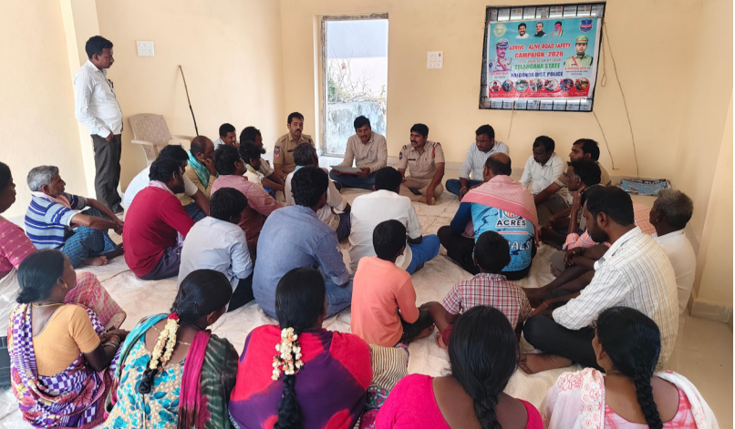
మాధులపల్లి/నల్గొండ /ఏప్రిల్ 13: (సామాజిక తెలంగాణ):-