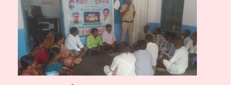
సామాజిక తెలంగాణ టెక్నాలజీ ప్రతినిధి