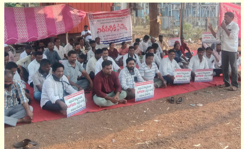
జహీరాబాద్ సామాజిక తెలంగాణ ప్రతినిధి ఏప్రిల్ 13.

జహీరాబాద్ నియోజకవర్గం సబ్ స్టేషన్ ఎదుట ఉద్యోగులు తమ సమస్యను పరిష్కరించుకుంటూ సబ్ స్టేషన్ ఎదుట ధర్నా చేయడం జరిగింది హక్కుల కోసం తమ వృత్తిని సైతం త్యాగం చేయకుండా సబ్ స్టేషన్ ఎదుట ధర్నా చేయడం సంచలనం లేవీంది. ఈ విషయంపై కార్మికులకు న్యాయం జరిగేంత వరకు జిల్లా కలెక్టర్ వెంటనే స్పందించాలని కార్మికుల ఆజ్ఞాపన. ఈ విషయంపై జిల్లా కలెక్టర్ గాని సంబంధిత అధికారులు గానీ వెంటనే స్పందించి కార్మికులకు న్యాయం చేయగలరని వారి విజ్ఞప్తి.