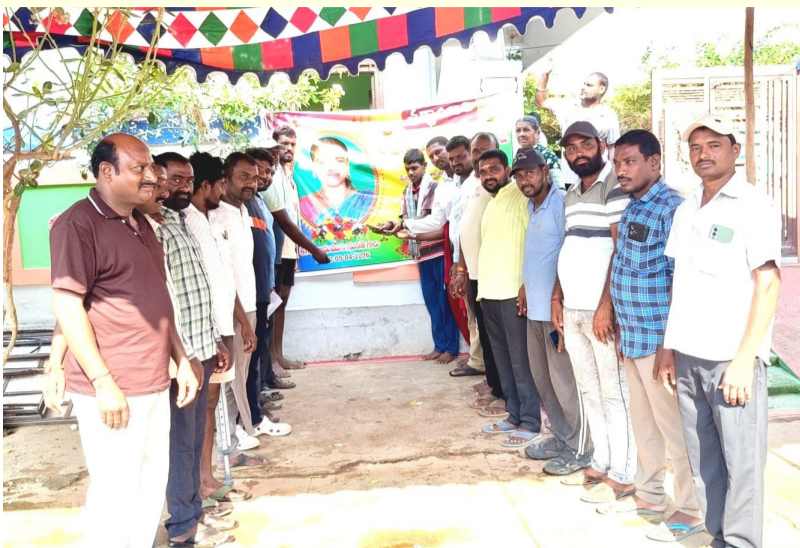
శాలిగౌరారం, ఏప్రిల్ 13, (సామాజిక తెలంగాణ):-