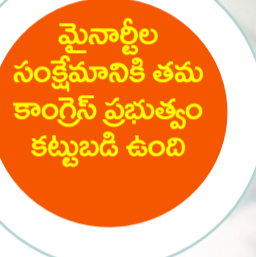
మైనార్టీల సంక్షేమానికి తమ కార్యక్రమాలను కట్టుబడి ఉంది