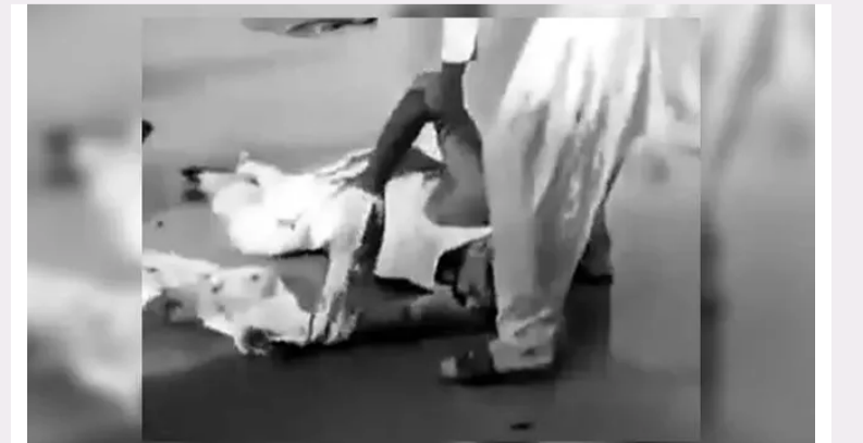
కాల్చి, కత్తులతో నరికి చంపారు. 2005 నుండి సంస్థలో కీలక పాత్ర పోషిస్తూ, నిధుల సమీకరణ, రికార్డుమెంట్ లో అంతేనైన సలాఫీని ఆనుపత్రిలో చేర్చించినా, చికిత్స పొందుతూ మరణించినట్లు నివేదికలు తెలిపాయి.