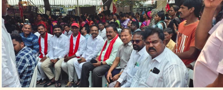
హైదరాబాద్, మార్చి 24 (సామాజిక తెలంగాణ) హైదరాబాద్ లోని ఇందిరా పార్క్ వద్ద సిపిఐ ఆధ్వర్యంలో నిర్వహించిన ఇళ్ల స్థలాల ఉద్యమం భారీగా జరిగింది.

ఇందిరా పార్క్ వద్ద భారీ నిరసన పేదలకు ఇళ్ల స్థలాలు వెంటనే ఇవ్వాలని డిమాండ్