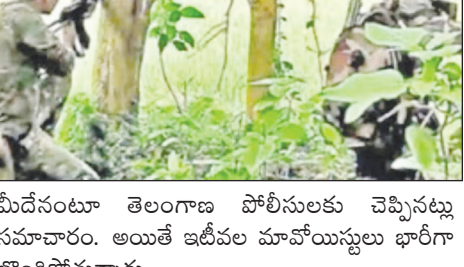
మీదేనంటూ తెలంగాణ పోలీసులకు చెప్పినట్లు సమాచారం. అయితే ఇటీవల మావోయిస్టులు భారీగా లొంగిపోతున్నారు.

హైదరాబాద్ (సామాజిక తెలంగాణ ప్రతినది): ‘ఆపరేషన్ గణపతి’. ప్రస్తుతం తెలంగాణ పోలీసుల ముందున్న అతి పెద్ద సవాల్. నాలుగు దశాబ్దాలకు పైగా మావోయిస్టు ఉద్యమాన్ని నడిపించి, కేంద్ర, రాష్ట్ర ప్రభుత్వాలకు కంటిమీద కునుకు లేకుండా చేసిన గణపతి అచూకీ ఇప్పటికీ తెలుసుకోలేకపోవడం ప్రభుత్వాల వెలితిగానే భావిస్తున్నాయి. ఇటీవల దిల్లీలో జరిగిన సమావేశంలో కేంద్ర హోంమంత్రి అమిత్ షా కూడా గణపతి గురించి ప్రత్యేకంగా చర్చించారు. అంతేకాదు లొంగిపోయేలా చూడాల్సిన బాధ్యత